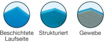
Beschichtete Laufseite Strukturiert Gewebe