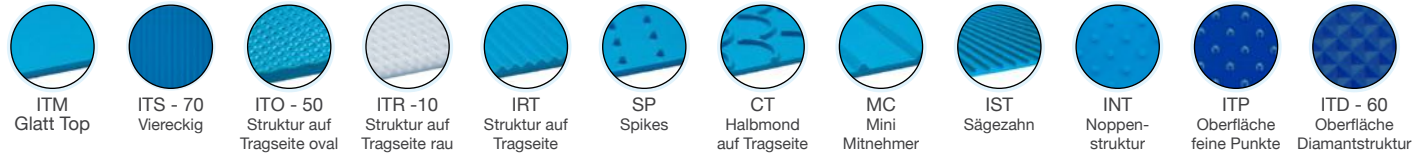
ITM Glatt Top ITS - 70 Viereckig ITO - 50 Struktur auf Tragseite oval ITR -10 Struktur auf Tragseite rau IRT Struktur auf Tragseite SP Spikes CT Halbmond auf Tragseite MC Mini Mitnehmer IST Sägezahn INT Noppenstruktur ITP Oberfläche feine Punkte ITD - 60 Oberfläche Diamantstruktur